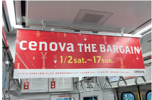
※中吊りワイドポスター