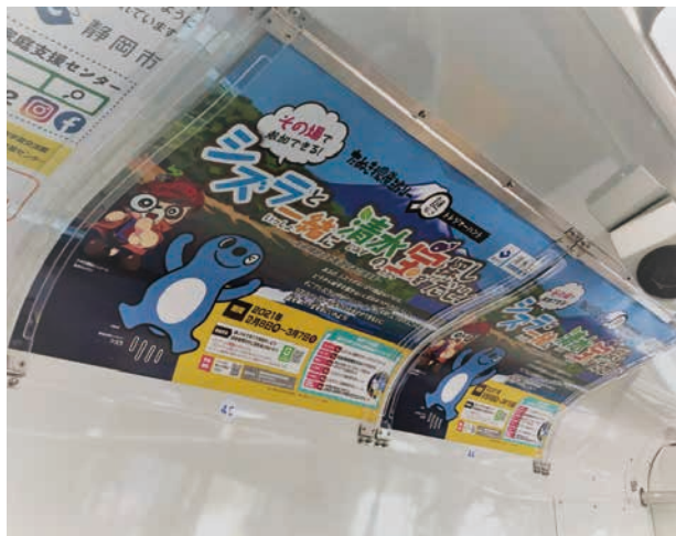
※電車窓上ポスター