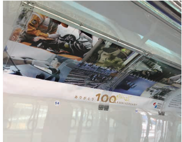
※電車窓上ワイドポスター