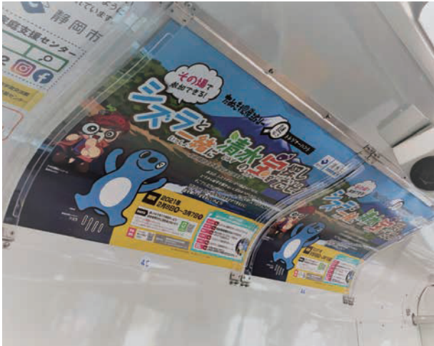
※電車窓上ポスター