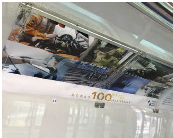
※電車窓上ワイドポスター