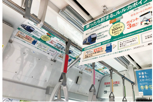
■中吊ポスターやラッピングとの相乗効果も期待できます