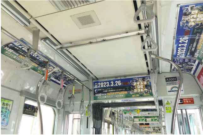
■電車中央にある連結部分のポスター枠16箇所を独占

電車中央連結部分の窓上ポスターを全て独占するセット広告。 インパクトのある告知をリーズナブルな価格で実施できます。