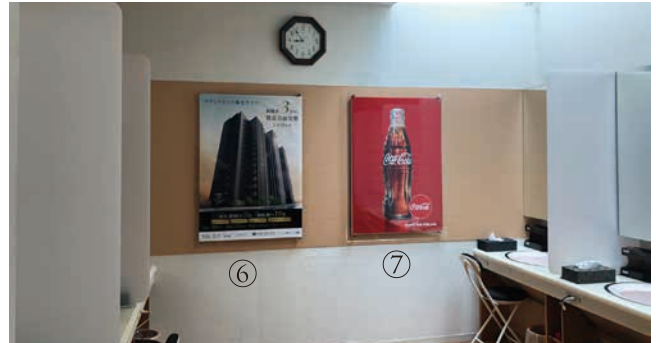
※女性パウダールーム