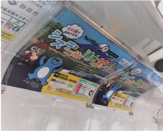
※電車窓上ポスター