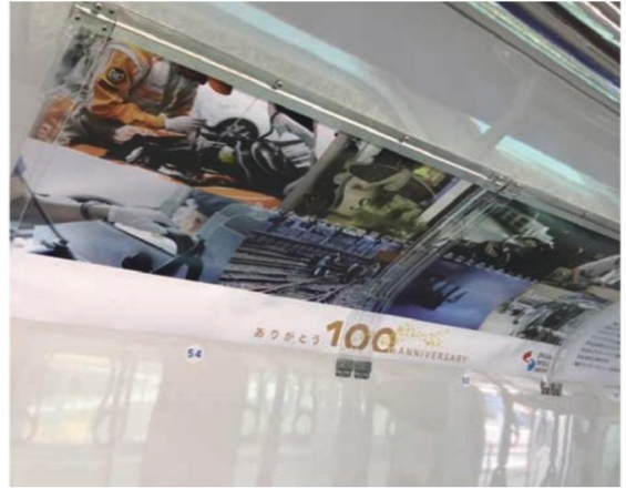
※電車窓上ワイドポスター